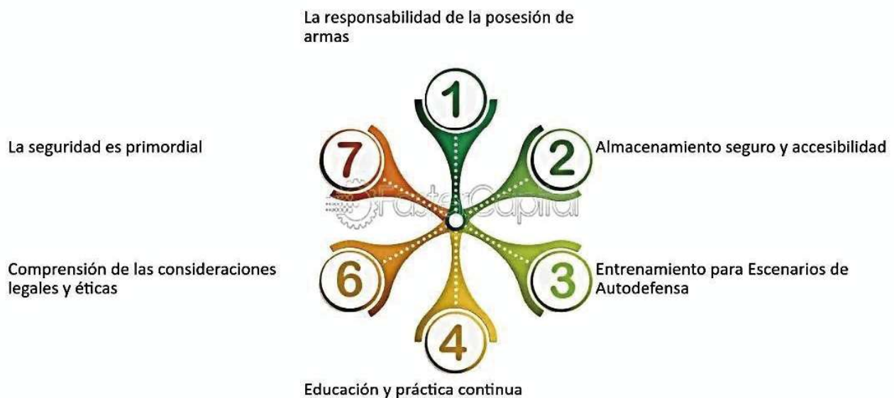
FIGURA 1 EL ENTRENAMIENTO EN EL USO DE AP

El entrenamiento policial se centra en la técnica y la destreza, cruciales para el rendimiento de los agentes. Desarrollar técnicas de acción policial en la intervención de conflictos es esencial en su ins-