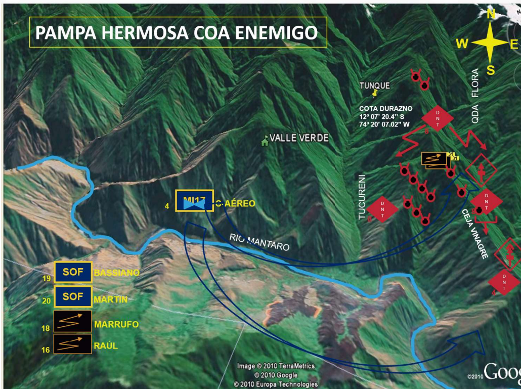
Plantilla situacional del enemigo - Dorsal "Vinagre"

Se tuvo en cuenta en la operación Roy que la guerra de movimientos que emplean los remanentes terroristas tiene como objetivo aniquilar a las Fuerzas Armadas y Policía Nacional (PNP) del CE-VRAEM para apropiarse de las armas y pertrechos militares, desarrollando su estrategia de la contraofensiva y aniquilamiento, se sabía y conocía también que la irrupción 19 era su primera y preferida táctica de combate por ser ofensiva y sorpresiva, con ella confiscaban armas y pertrechos militares, los DNT realizaban el estudio previo de su objetivo dentro de la zona de combate con la finalidad de emboscarlos en las rutas comúnmente empleadas, los terroristas tenían la destreza de engañar a las patrullas con el fin de que tomen rutas conocidas por ellos, se preparaban en el terreno para las posiciones de ataque terrorista, tenían un grupo de irrupción